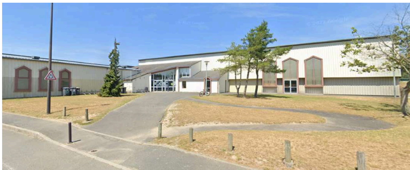
Salles Athéna ( réunion de juges )

Rue Simone de Beauvoir 44119 Treillières