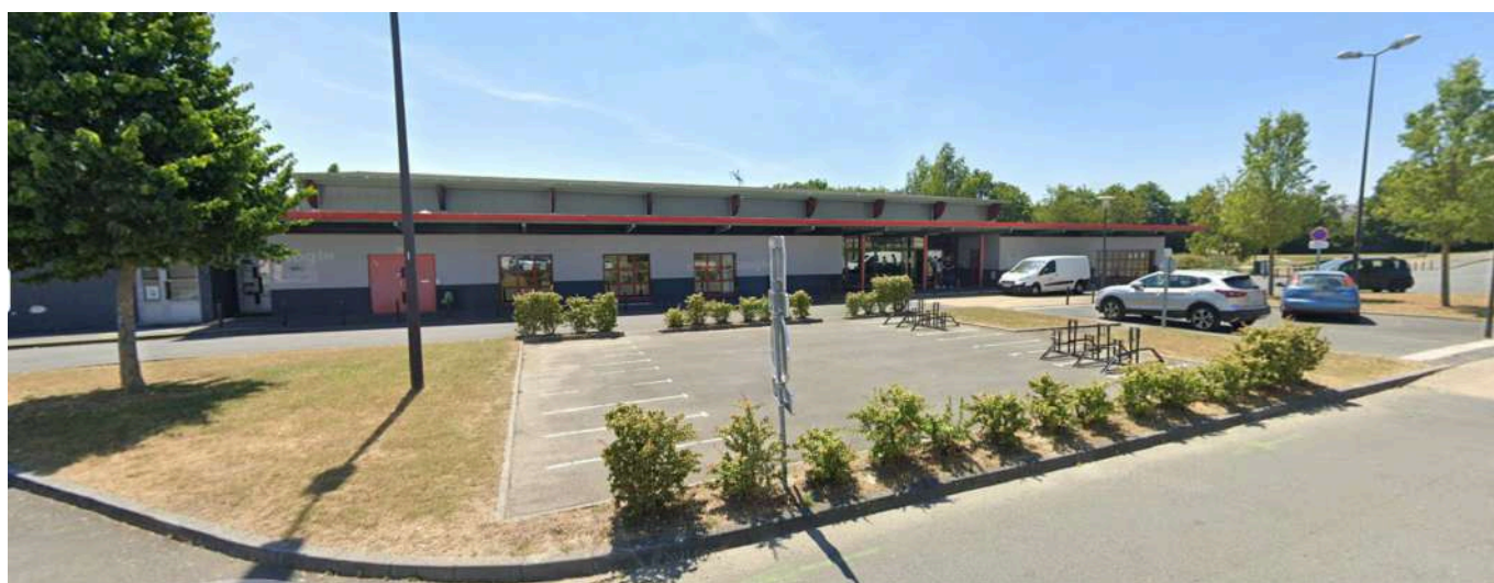
Salles Marathon ( réservée aux gymnastes ) et Héraclès ( salle de compétition )